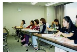
日本語講座の生徒さん